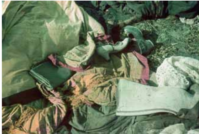
Бабин Яр. Речі розстріляних. Музей історії м. Києва.