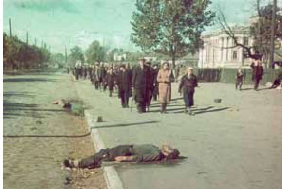
Трупи розстріляних на вул. Києва. Музей історії м. Києва. Фото І. Хеле.

вміщують важливі відомості і факти (значна більшість їх ще не залучалася до відкритого наукового обігу), дає можливість краще зрозуміти таке непросте явище, як трагедія Бабиного Яру, сприяє відтворенню повнішої картини цієї жахливої трагедії. Перш ніж перейти до розгляду документів, стисло нагадаємо про події, що відбувалися в місті у 1941–1943 рр. і про які йдеться у матеріалах архіву, для того, щоб краще уявити яку вони несуть цінну інформацію.