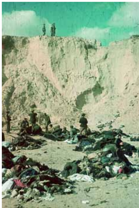
Бабин Яр. Радянські військовополонені розбирають речі розстріляних. Музей історії м. Києва.