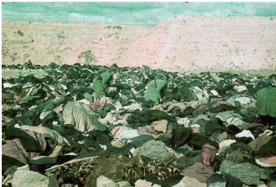
Бабин Яр. Німецькі солдати копаються у речах розстріляних.

ративної групи “С” роти військ СС оберштурмфюрер СС Графхорст; надалі його рота використовувалась для несення охоронної служби в місті, а наприкінці жовтня 1941 р. переведена в дивізію СС “Вікінг” 21 .